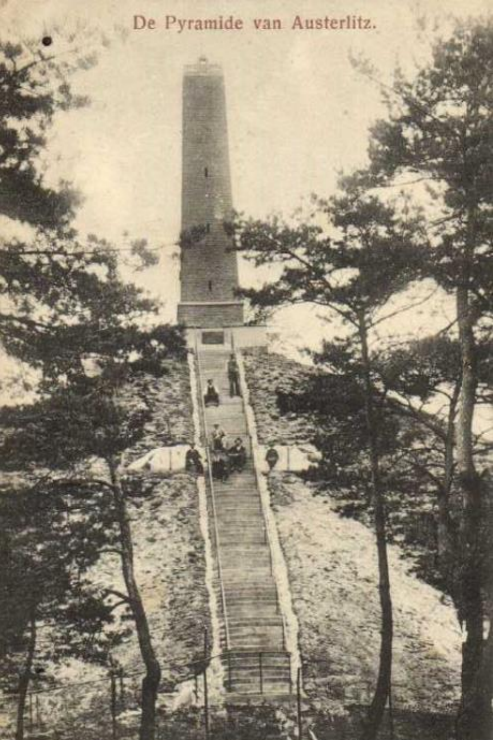
De Pyramide van Austerlitz.